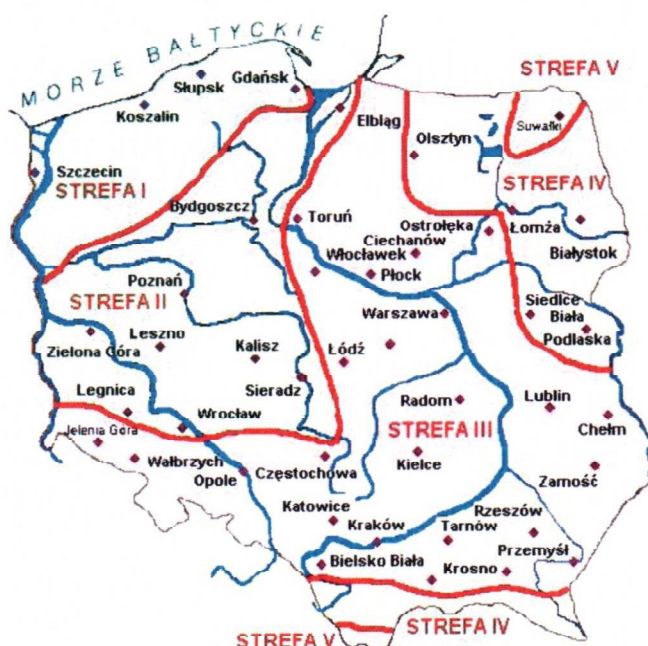
Rys. 1 Strefy klimatyczne Polski i temperatury obliczeniowe

Położenie obiektu, w którym planowany jest montaż, na mapie ma wpływ na pracę instalacji. W zależności od współrzędnych geograficznych rozbieżności w temperaturach projektowych mogą mieć znaczącą wartość. W skali kraju ilustruje to poniższa mapa (Rys.1).